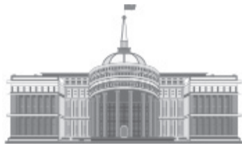
Жолдау мұраты – ел мүддесі